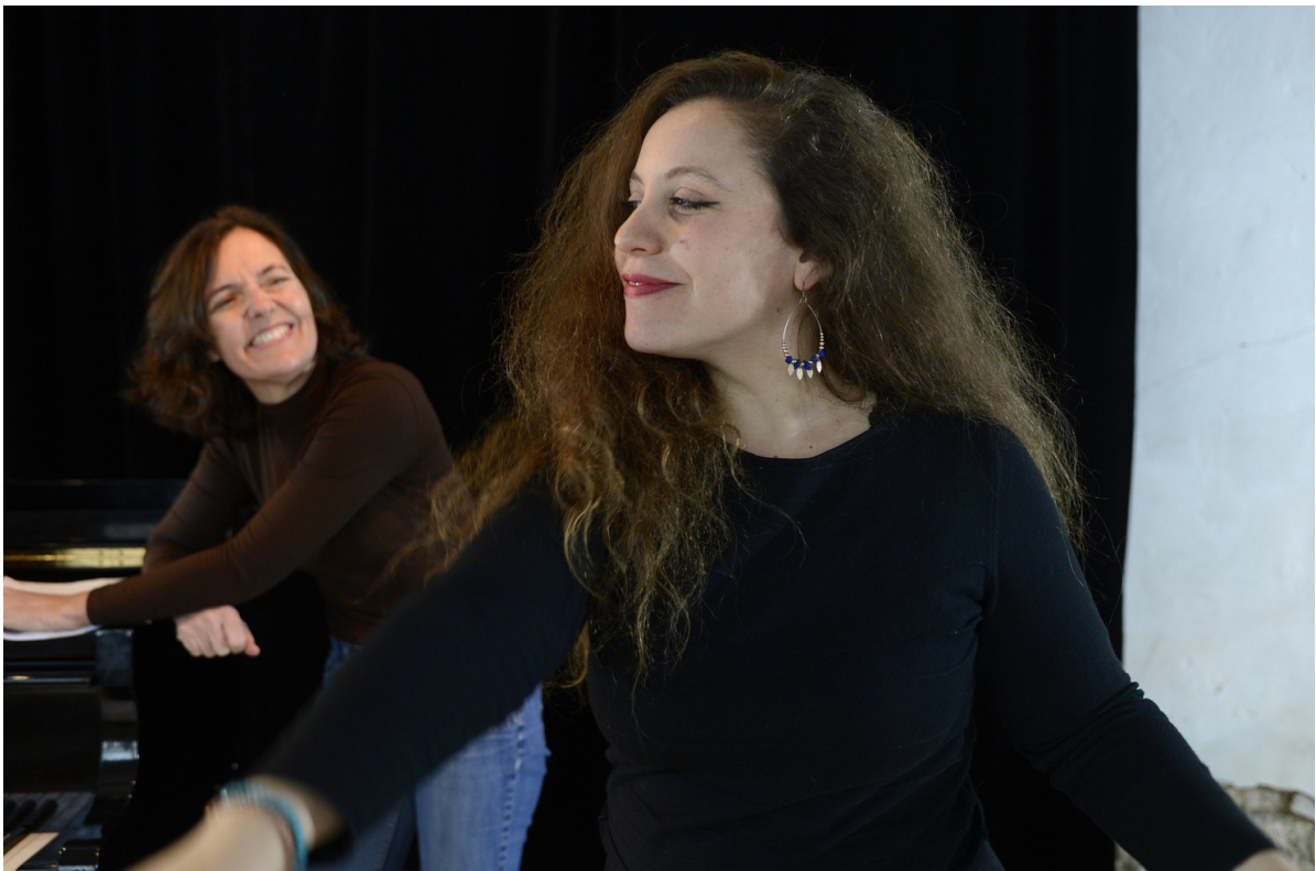
Mars 2024 Résidence Arcal Lyrique

Une pièce jalonnée par des airs de Ferré, Gounod, Chostakovitch, Offenbach, Massenet, Saint Saëns, Berlioz, Puccini, Aznavour, de Tejada, Verdi.