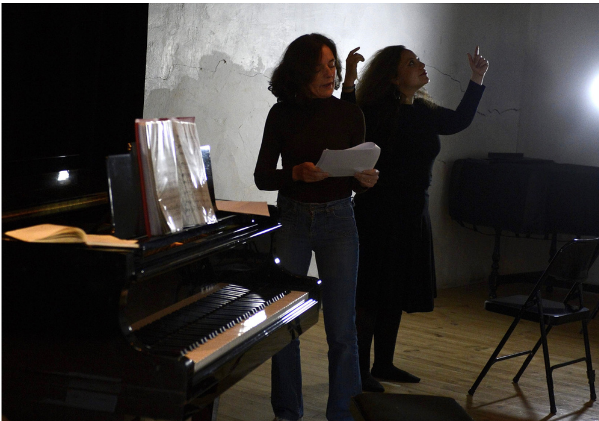
Mars 2024 Résidence Arcal Lyrique

En somme il s'agit toujours de rêver et d'inviter les autres à en faire autant.